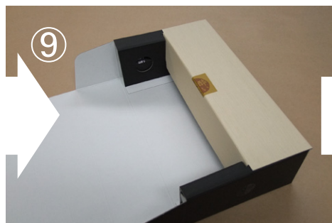
⑨ 差し入れます。なかなか入らないときは、上部 および下部のパッドの位置を調整しながら、 行なってください。