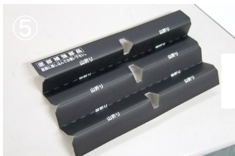
⑤ 下部用パッド(下部部品)を波状に折り・・・ (実線=山折り、破線=谷折り)