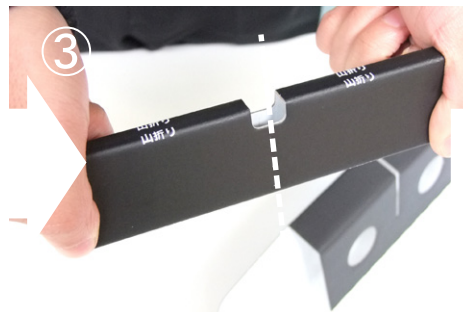
③ (②をウラから見たところ) 一方だけ使用する 場合は、ミシン目で切して下さい。