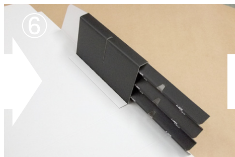
⑥ 向きに注意して、本体に差し込んで下さい。