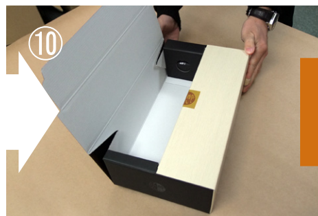
⑩ 逆側のふたも、同様に折り込みます。