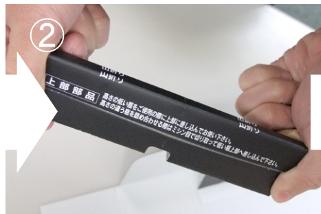
② 背の低い瓶を使用する場合は、上部用パッド (上部部品)をこのように折ってご使用下さい。