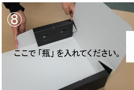
⑧ ふたを折り込んで・・・ ※3本入は「中仕切」を差し込んでから、ふた を折り込んでください。